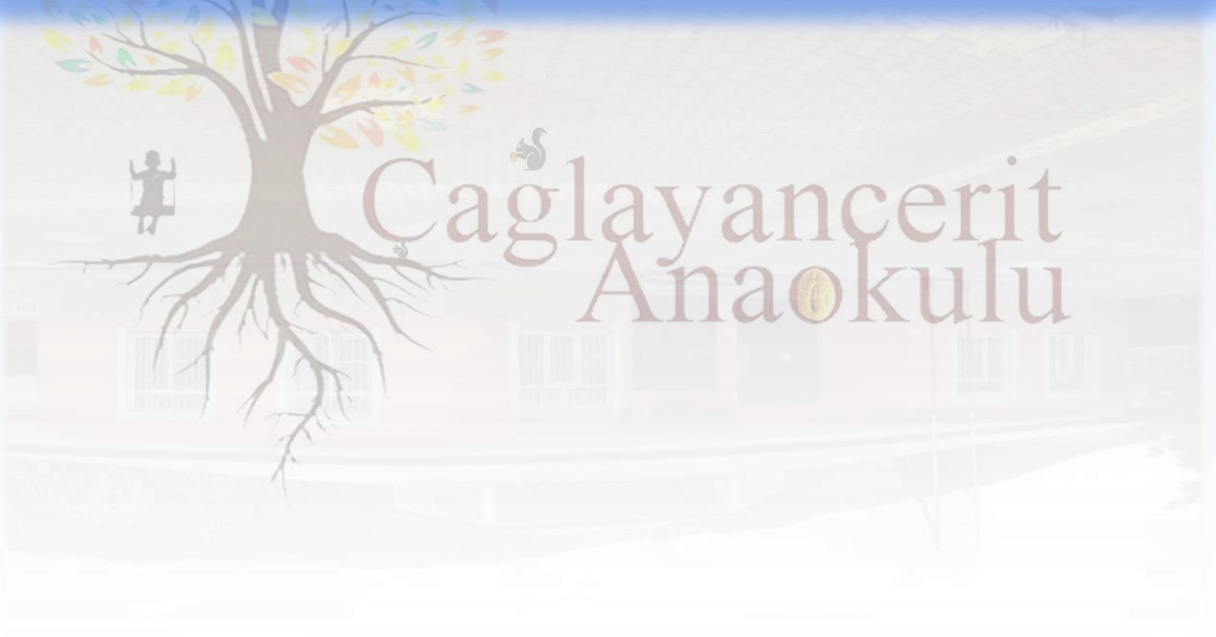
Çağlayancerit Anaokulu Binası